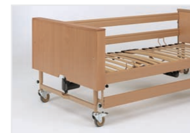
Holzfüllung zur Verkleidung des Fahrgestells (auch nachträglich montierbar)