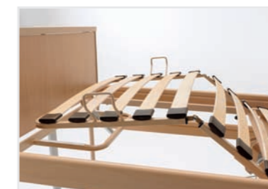
Unterschenkellehne durch Rastomat anhebbar (Rastomat auch nachträglich montierbar)